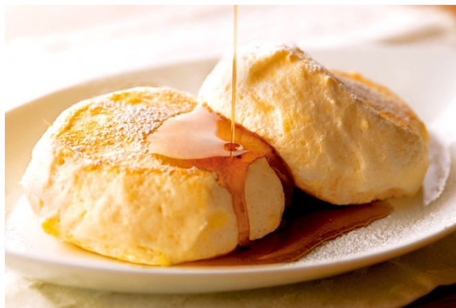
“むさしの森珈琲特製” ふわっとろパンケーキ

「むさしの森珈琲」は、「オールデイリビング」—ゆとりの癒し空間—をコンセプトに掲げたブランドで、朝・昼・夜を問わずゆっくりと好きな過ごし方ができる、地域のコミュニティカフェを目指しています。こだわりのドリンク・フードメニューを多彩に取り揃えており、お客さまに大変ご好評をいただいております。