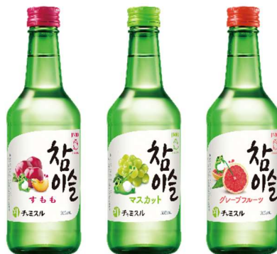
「 チャミスル 」 (すもも/マスカット/グレープフルーツ)