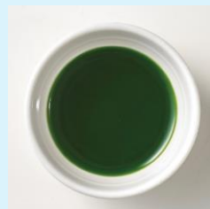
抹茶ソース (西尾の抹茶)