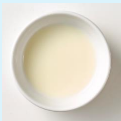
杏仁みるくソース