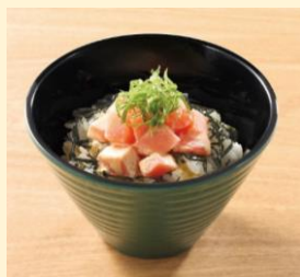
ちいさなサーモンごはん