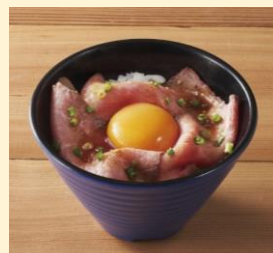
ちいさなローストビーフごはん