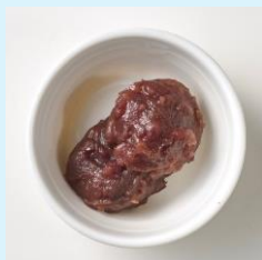
小豆 (北海道産十勝小倉あん)