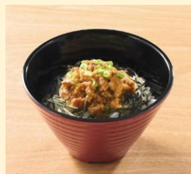
ちいさな炭火焼肉ごはん

※「選べるちいさなごはん」はいずれも、単品ご注文の場合、399円（税込439円）となります