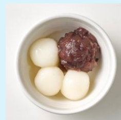
白玉小豆 (北海道産十勝小倉あん)