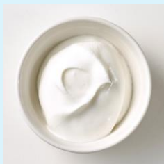
練乳みるくクリーム