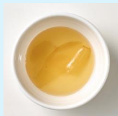
ジンジャーソース (高知県産生姜)