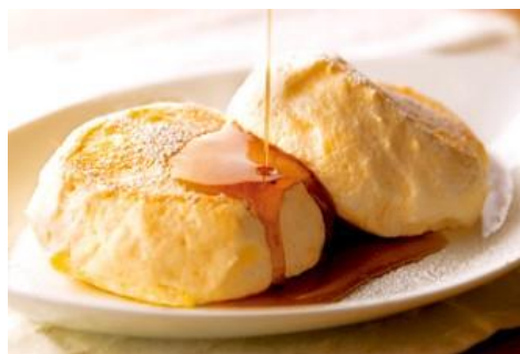
“むさしの森珈琲特製”ふわっとろパンケーキ (蜂蜜入メイプルシロップ添え)