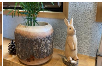
～店内にはかわいい動物たちがたくさん隠れています～