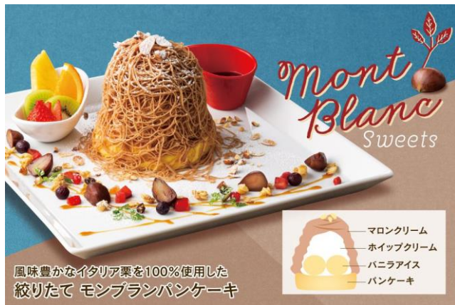
風味豊かなイタリヤ栗を100%使用した 絞りたて モンブランパンケーキ