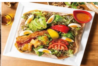
～ロコモコやスーパーフードを使用したヘルシープレート～