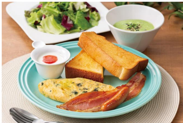
オムレツなどモーニング限定メニューも多数ご用意