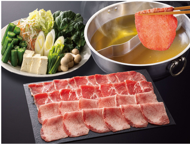
＜牛たん食べ放題コース・価格表＞