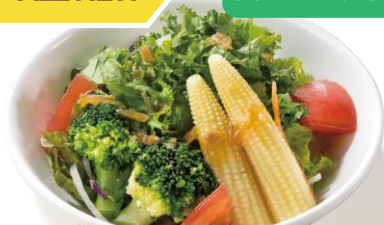
ゴロゴロ野菜サラダ [1人前] 249～299円（税込274～329円）