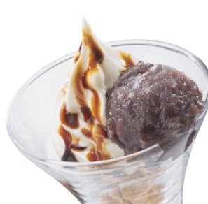
あんこソフト 299円（税込329円）