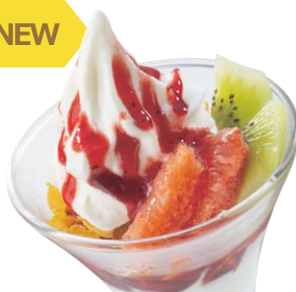
フルーツヨーグルトソフト 399円（税込439円）