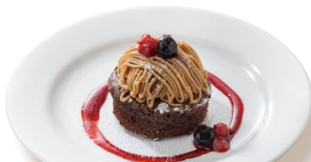
モンブランONガトーショコラ 499円（税込549円）