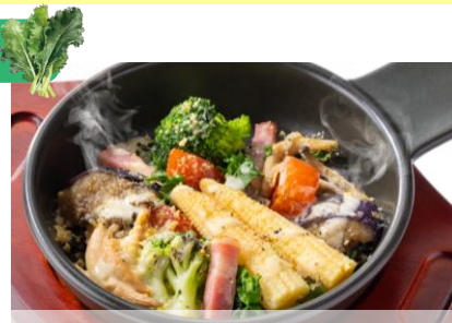
彩り Grill 野菜 399～449円（税込439～494円）