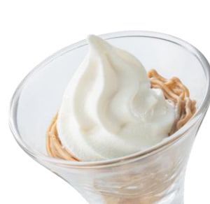
マロンソフト 299円（税込329円）