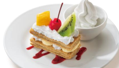
フルーツミルフィーユ&ソフトクリーム 499円（税込549円）