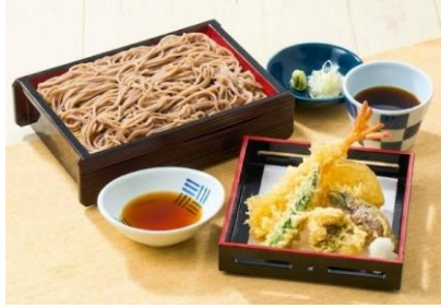
※写真は「瀬戸内鰹(はも)の季節天せいろそば」