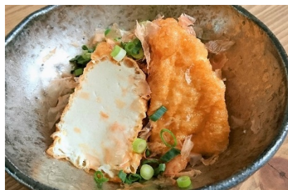
武雄市のざる揚げ豆腐