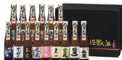
佐賀県が誇る「佐賀ん酒」