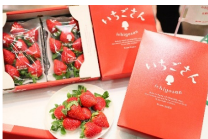
新ブランド「いちごさん」