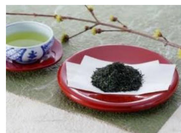
農林水産大臣賞受賞の「うれしの茶」