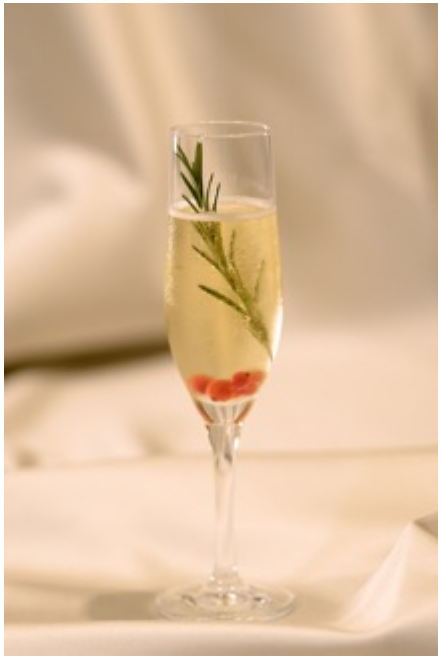
ウェルカムドリンク