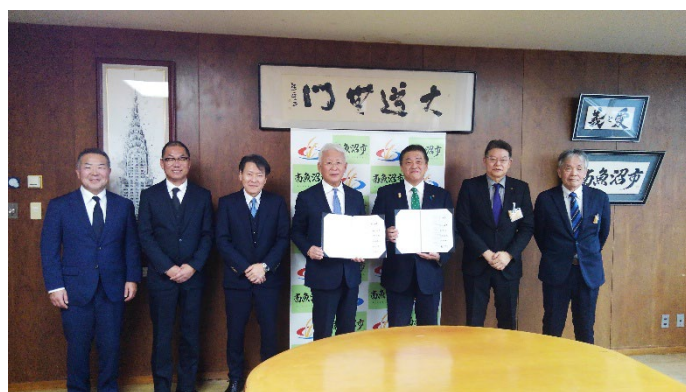
12 月 25 日 新・道の駅南魚沼における指定管理予定者に関する覚書取り交わし式にて「南魚沼・白の夜明け共同体」を構成する 5 団体の代表と南魚沼市の林茂男市長（左から 5 人目）小高直弘副市長（左から 6 人目）