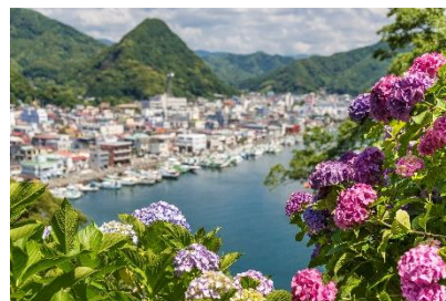
【下田公園のあじさい】

◆下田公園で開催される「あじさい祭」へのお出かけに便利な列車を運転します。広大な敷地を埋め尽くすおよそ 300 万輪のあじさいは、訪れた人々を魅了します。