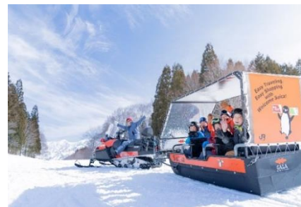
【GALA 湯沢スキー場】