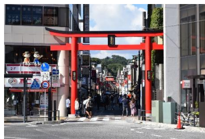
【小町通り】

◆鎌倉へのお出かけに便利な列車を運転します。五日市線や青梅線、常磐線などの各沿線から鎌倉まで乗り換えなしで行ける直通列車で、鎌倉散策をぜひお楽しみください。