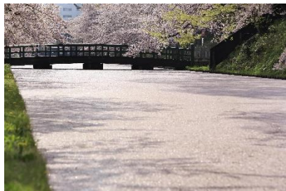
【弘前さくらまつり】

◆「弘前さくらまつり」へのお出掛けに便利な列車を運転します。幾重にも重なるように咲き誇る優美な姿、弘前城のお濠が桜の花びらで一面ピンクに埋め尽くされる光景をぜひご覧ください。