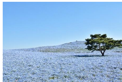
【ネモフィラ】

◆国営ひたち海浜公園での「ネモフィラ」観賞に便利な列車を首都圏各地から運転します。ネモフィラが丘一面に咲き誇る様子は、まさにこの時期しか見ることのできない「絶景」です。