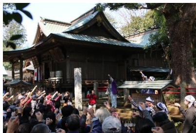
【神崎神社での乾杯風景】

◆「酒蔵まつり」の開催にあわせて便利な列車を運転します。300 年以上の伝統を持つ酒蔵の見学や有料の試飲イベントなど、ぜひ列車を利用した旅をお楽しみください。