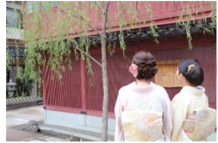
【金沢市ひがし茶屋街】