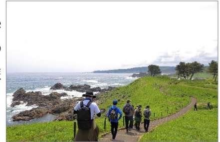
写真:みちのく潮風トレイル

2025 年秋ごろに東北エリアにて開催が予定されている「Adventure Week」(※) を契機として、東北独自の自然、文化、アクティビティ等の魅力と、東北新幹線による首都圏からの訪れやすさや長期での東北周遊のしやすさを PR し、東北への誘客に貢献します。