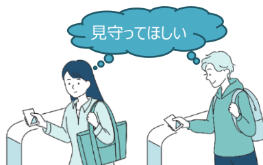
【契約者（サービス対象者）】

※高校生（満18歳の3月31日まで）で契約中の場合、自動更新はされません。契約終了後に、サービス対象者ご本人による新規入会が必要となります。