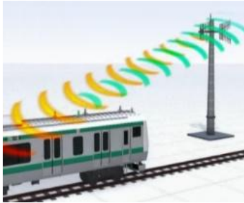
ATACS + 高性能 ATO の導入