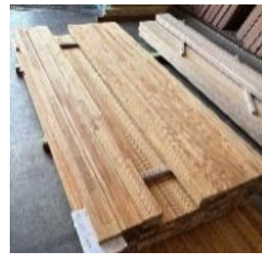
鉄道林の建築部材としての活用