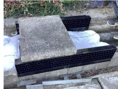
550 トラフ用樹脂製嵩上げ材の開発