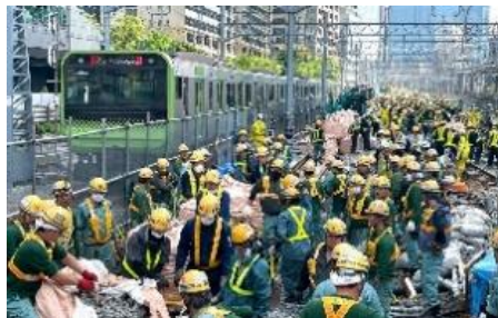
羽田空港アクセス線整備