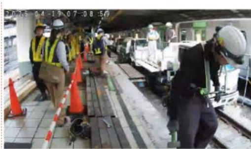
大規模切換工事でのクラウドカメラ