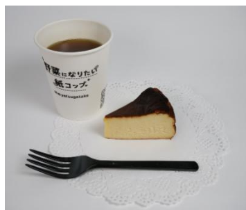
酒粕チーズケーキ(1ピース)