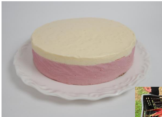
収穫した赤いルバーブ▶