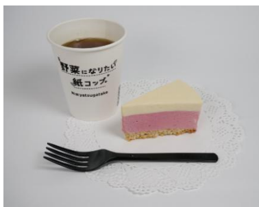
赤いルバーブチーズケーキ(1ピース)