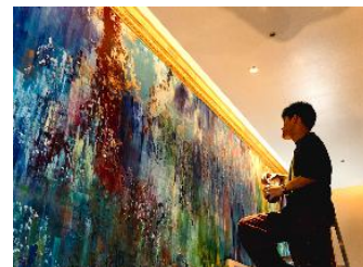
写真1. ライブペインティング イメージ