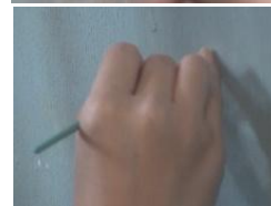
写真4. 『《自由》に寄せて』 映像撮影・編集：斎藤玲児