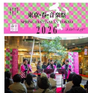
写真 11. 東京・春・音楽祭イメージ

東京感動線 X アカウント: https://www.twitter.com/tokyo_moving_o/