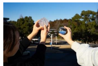
写真 10. ガラスワークショップのイメージ