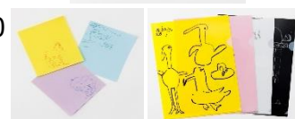
写真3. ミュージアムグッズイメージ