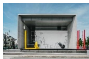
写真 7. 丸亀市猪熊弦一郎現代美術館（MIMOCA）