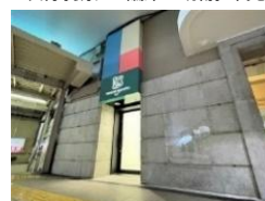
写真5. CREATIVE HUB UENO “es”