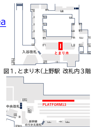
図1. とまり木(上野駅 改札内3階)