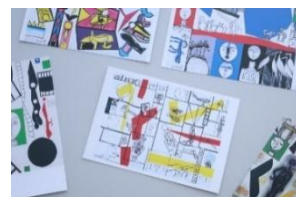
写真 8. ポストカードイメージ