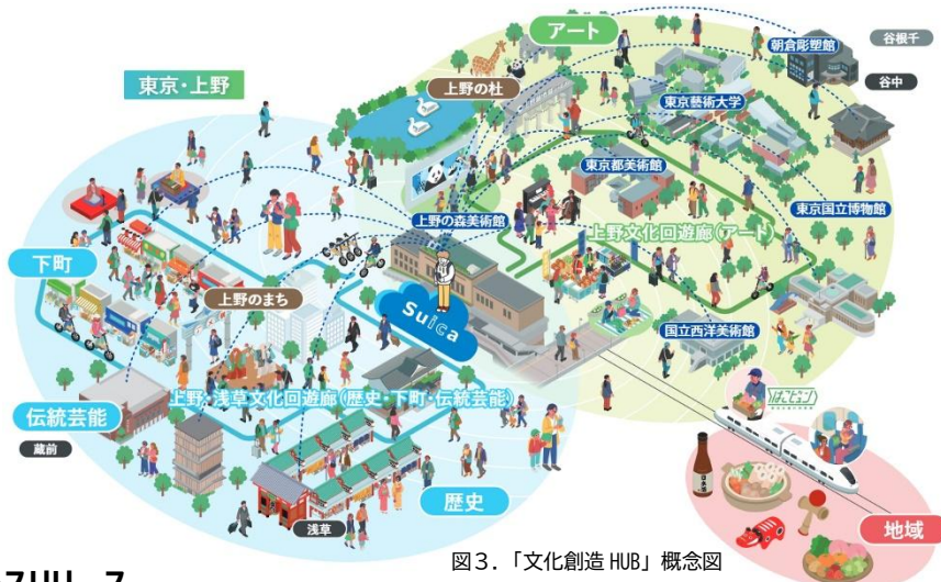
図3. 「文化創造 HUB」概念図

Suica を活用したアート・歴史・下町文化の回遊環境を整え、シームレスな移動と豊かな文化体験を実現するとともに、東北・上信越などの地域の魅力を駅から発信し、観光・交流の拡大につなげます。