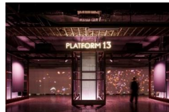
写真 6. PLATFORM13

※輸送障害時など、都合により 13 番線ホームへの立ち入りを規制する場合や事前の告知なく投映を停止する場合がございます