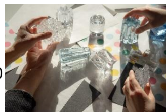
写真 9. ガラスワークショップのイメージ