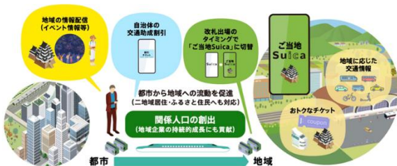
ご当地Suicaによる関係人口の創出の促進

今後は、「二地域居住」に不可欠な移動を担うJR東日本とJALとが連携することで移動負担の軽減を図るほか、二地域居住の推進を図る自治体と連携しながら、2027年春より開始する「ご当地Suica」を活用して二地域居住者(ふるさと住民)を対象とした独自サービスや地域の助成割引等の支援メニューの拡充を進めます。