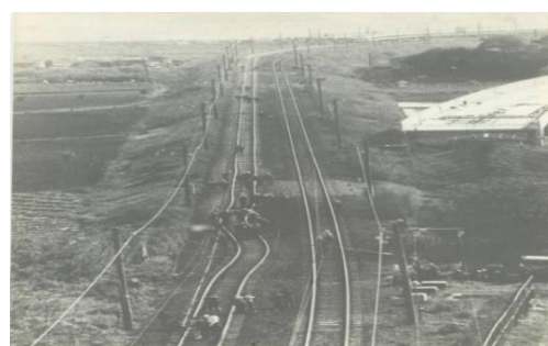
高温時のレール張り出し現象 (1978年5月 東北本線 栗橋～古河駅間)