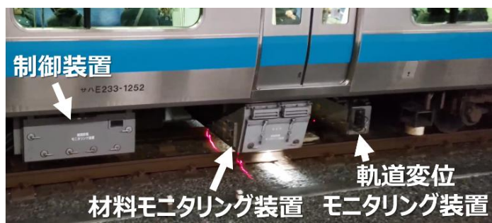
線路設備モニタリング装置