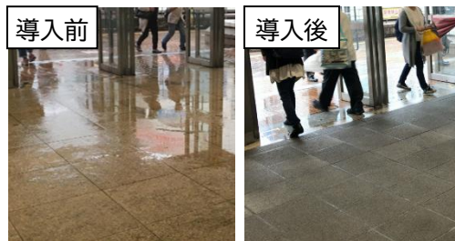
雨天時の大宮駅コンコースの様子