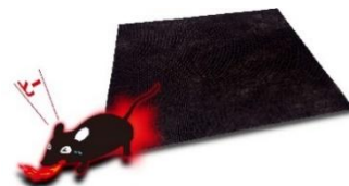
鼠に対する忌避効果のイメージ