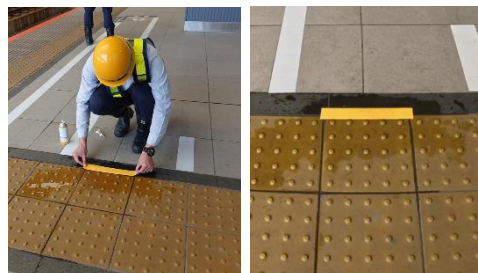
雨天時を想定した点字ブロック修繕作業