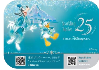
車内ステッカーのイメージ

今回の「Magical Jubilee Shinkansen」は、さまざまな海の魅力から着想を得た東京ディズニーシー25周年のテーマカラー「ジュブリーブルー」を基調に、アニバーサリーイベントの特別な衣装に身を包んだミッキー・マウスやディズニーの仲間たち、そして東京ディズニーシーのシンボルでもあるディズニーシー・アクアスフィアやプロメテウス火山などが描かれ、東京ディズニーシー25周年の祝祭感を表現した特別な車両です。車内においても、座席の枕や車内メロディなどで「東京ディズニーシー25周年“スパークリング・ジュブリー”」の雰囲気を感じることができます。特別車両「Magical Jubilee Shinkansen」で、祝祭感あふれる新幹線の旅をお楽しみください。