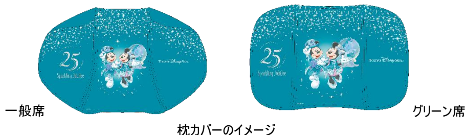
枕カバーのイメージ