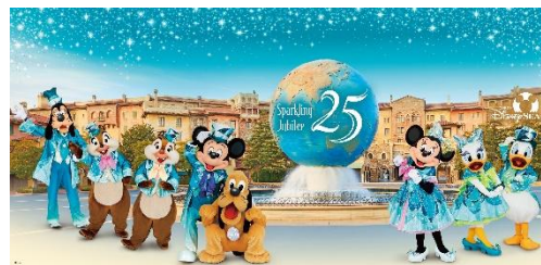
フォトスポットのイメージ

※詳細は東京ディズニーリゾート・オフィシャルウェブサイトにて 決まり次第お知らせします。