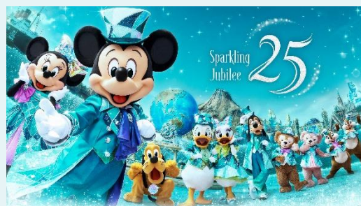
「東京ディズニーシー25周年 “スパークリング・ジュビリー”」

https://www.tokyodisneyresort.jp/treasure/tds25th/