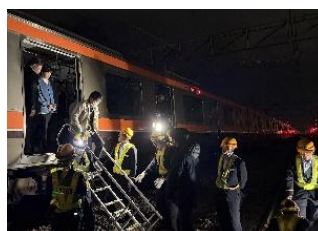
夜間での降車誘導訓練