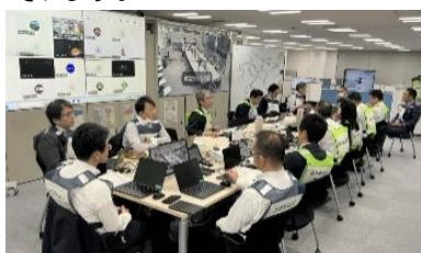
大規模な輸送障害を想定した対策本部運営訓練

大規模な輸送障害を想定した訓練や降車誘導訓練をより実践的な内容にレベルアップさせます。具体的には、現車を用いた訓練と机上の訓練を組み合わせながら、駅間停車している付近の地形や時間帯、乗車人員等といった複数の条件を想定した訓練を実施します。また、警察・消防関係者との合同訓練や、お身体が不自由な方に実際に降車誘導を体験していただく等の訓練も実施しています。