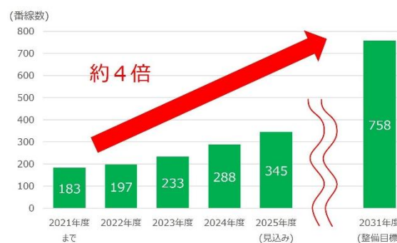
ホームドア整備数の推移