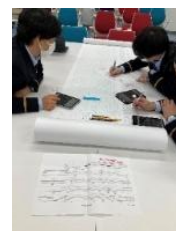
発生状況などを速やかに図示する訓練