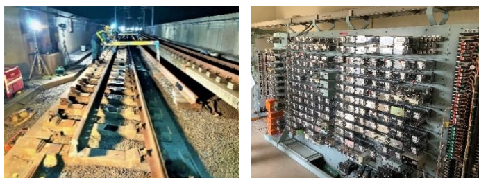
特に力を入れる修繕内容 (左図：レール交換 右図：信号リレー取替)