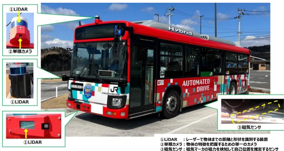
①LIDAR : レーザーで物体までの距離と形状を識別する装置 ②単眼カメラ : 物体の特徴を把握するための単一カメラ ③磁気センサ : 磁気マーカーの磁力を検知して自己位置を推定するセンサ