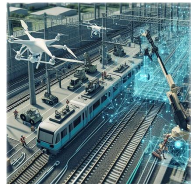
鉄道電気部門のスマートメンテナンスのイメージ

なお、JR 東日本グループでは、以下の各社も「第 2 回鉄道技術展・大阪 2026」に出展します。