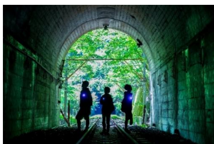
碓氷峠 廃線ウォーク