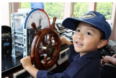
奥只見湖遊覧船 船長体験

商品詳細： https://link.jrview-travel.com/qfkw8