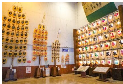
秋田市民俗芸能伝承館 ねぶり流し館