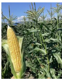
あぐりーむ昭和 とうもろこし収穫体験

家族みんなで楽しめる群馬の味覚体験バスツアーです。高崎駅を出発し、昭和村の「道の駅 あぐりーむ昭和」へ。旬のとうもろこし収穫体験は、お子さまにも大人気！採れたて野菜のお買い物も楽しめます。