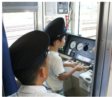
えちぜん鉄道・電車運転体験