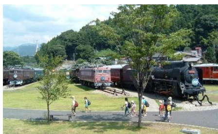
碓氷峠鉄道文化むら

1997年に北陸新幹線開業により廃線となった旧信越本線・横川駅～軽井沢駅間。両駅を隔てる、かつて鉄道屈指の難所として知られた「碓氷峠」には、線路や橋、トンネルが昔のままの姿で残されています。普段は立ち入りが禁止されているエリアの一部を専門ガイド同行で散策します!トンネルをくぐり抜けて線路の上を歩いたり、線路の上でお弁当を食べたり、普段はできない廃線ならではの体験をお楽しみください。