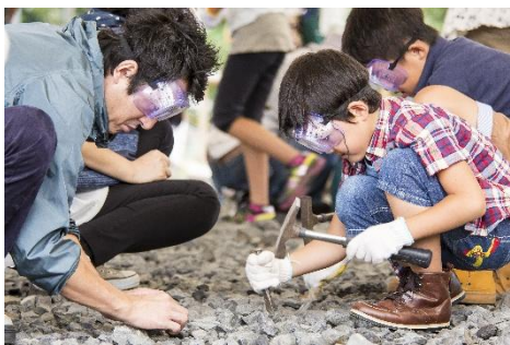
かつやま恐竜の森・化石発掘体験

商品詳細: https://link.jrview-travel.com/ttc6q