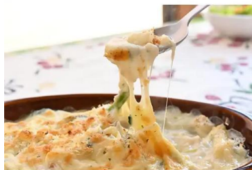
奥利根ワイナリーレストラン お食事一例

午後は道の駅川場田園プラザで自由にショッピングと散策を楽しみ、高崎駅へ戻ります。