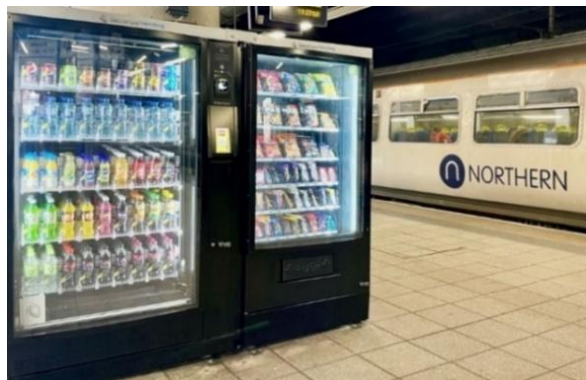
デコラム社がイギリスの駅で展開する自販機

この度、ロンドン・ヒースロー空港やロンドン・ガトウィック空港、ロンドン・ルートン空港など、イギリス国内の主要空港において約 800 台を展開する自販機事業を新たに取得しました。これにより、駅に加えて空港の交通結節点での展開を進め、運営台数は 1,800 台規模へと拡大します。