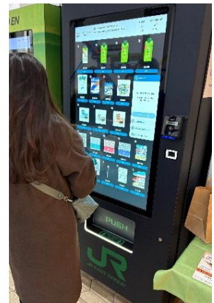
鉄道グッズや燕三条の地産品を販売