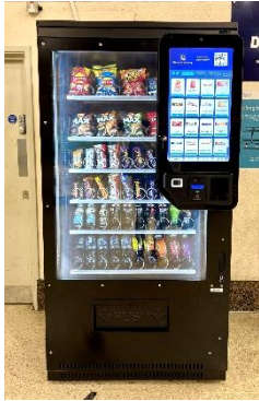
新型タッチパネル付き自販機

あわせて、地域の特産品や地産品を取り扱う自販機の展開にも取り組み、利用者に新たな購買体験を提供するとともに、地域の魅力発信にも貢献していきます。