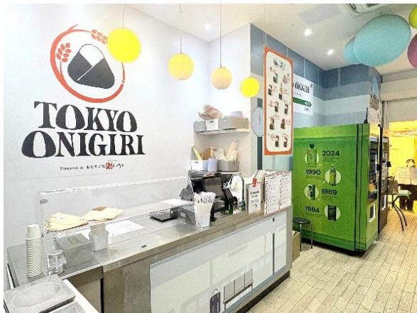
TOKYO ONIGIRI（監修：おむすび処ほんのり屋）を開業し、ロンドン市内で出来立てのおにぎりを販売

本取り組みを通じて、海外都市における公共交通中心のライフスタイルのさらなる進化を促し、JR 東日本グループ経営ビジョン「勇翔 2034」に掲げるライフスタイル・トランスフォーメーション（LX）を実現してまいります。