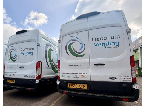
JR 東日本グループロゴ入りのデコラム社用車