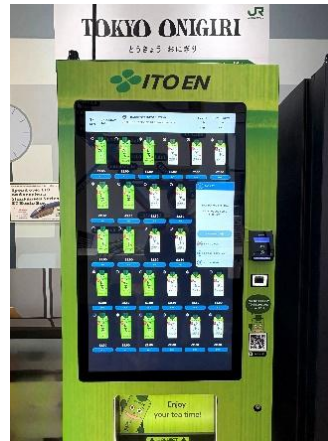
伊藤園と連携した「おーいお茶」自販機の設置