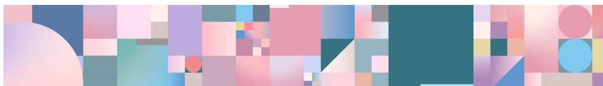
アート文化を表現する動画