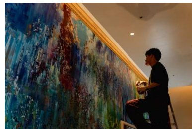
ライブペインティングの様子

参考 WEB サイト： https://camp-fire.jp/projects/926309/view (募集終了)