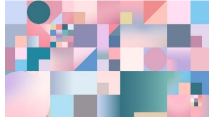
UENO FREEDOM COLOR