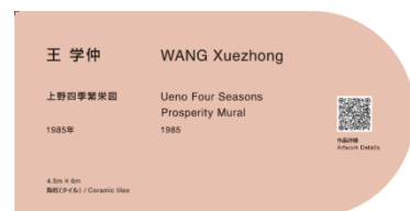
キャプションサイン

また、代表的な 5 作品について、東京藝術大学の先生による解説動画を 2026 年 6 月 16 日(火)からご覧いただけます。多様な専門視点で作品の魅力伝えることで、文化体験の深化を図ります。