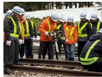
本年2月～3月に実施した特定技能人材育成研修の様子