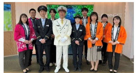
※各駅と駅商業施設担当者（左より市川駅、本八幡駅、福島駅）