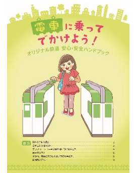
ハンドブックイメージ