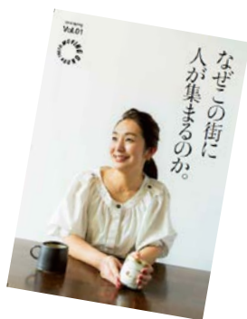
Vol.01 「なぜこの街に人が集まるのか。」