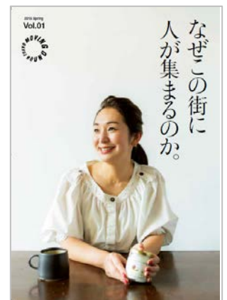
創刊号 Vol.01 表紙

山手線沿線の駅周辺のまちに、暮らし・働き・足を運ばれる 20-60代の男女で、文化、伝統、自然、街並み、 食、交流などに興味をお持ちで、豊かなライフスタイルを実践し、 または関心の高い方