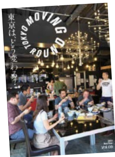
Vol.00 「東京は、どう変わる？」