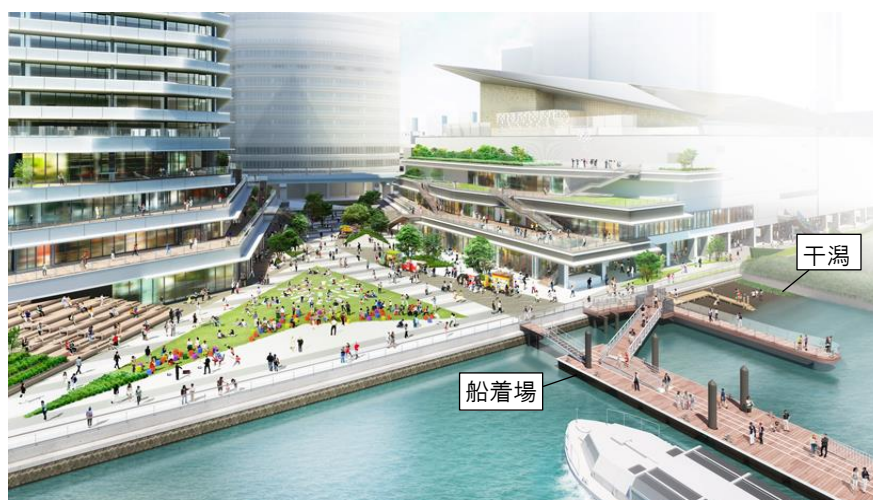
広場・テラス・水辺のイメージ