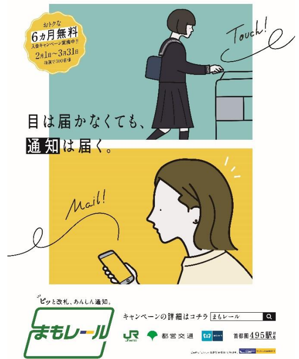
キャンペーンポスターイメージ