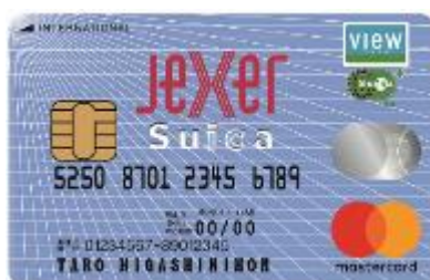
ジェクサーカード