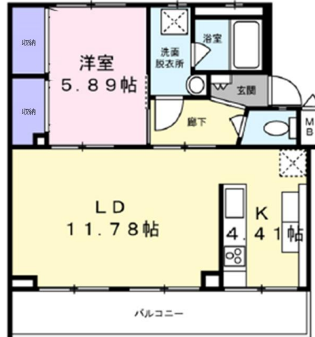
Bタイプ (1LDK) 12戸

明るく開放的なリビングに加え、独立キッチンはアイデア次第で様々な使い方ができます