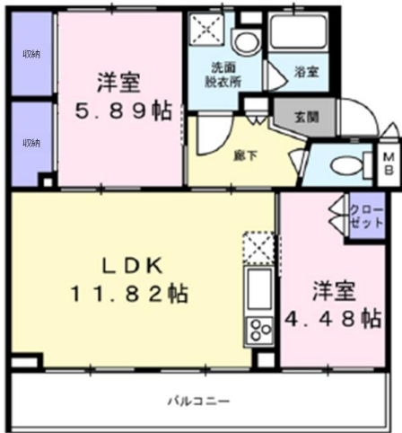
Aタイプ (2LDK) 12戸

室内はファミリー世帯をターゲットに毎日の生活を豊かにするような部屋プランを設けています。