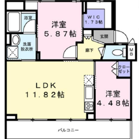
Cタイプ (2LDK) 36戸

明るく開放的なリビングに加え、独立キッチンはアイデア次第で様々な使い方ができます