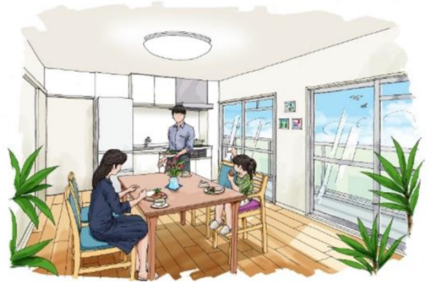
Cタイプ住戸完成イメージ

本物件は閑静なJR東日本社宅の敷地内にあり、敷地の目の前には武蔵野市立山中南公園も位置しているため、穏やかな環境で毎日の生活が送れます。