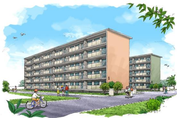
建物外観完成イメージ