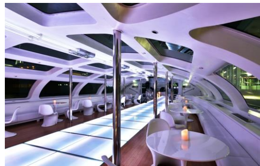
船内画像 HIMIKO 店名 (Jicoo the floating bar)