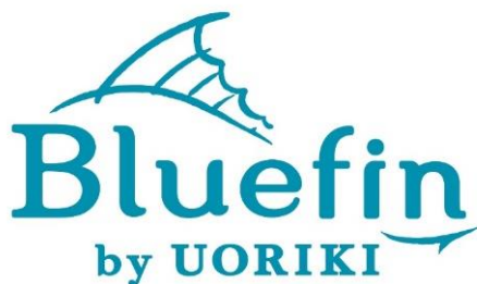
Bluefin by UORIKI

2020年8月にグランドオープンしたアトレ竹芝に、新たにシーフードレストラン「Bluefin by UORIKI」、シンガポール料理「シンガポール シーフード リパブリック東京」の2店舗が開業します。