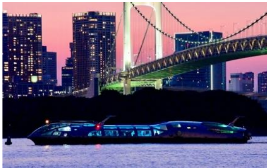
使用船舶 HIMIKO 店名 (Jicoo the floating bar)

※1 運航開始日は 旅客不定期航路事業申請の認可後 、舟運事業者HPにより公開されます。