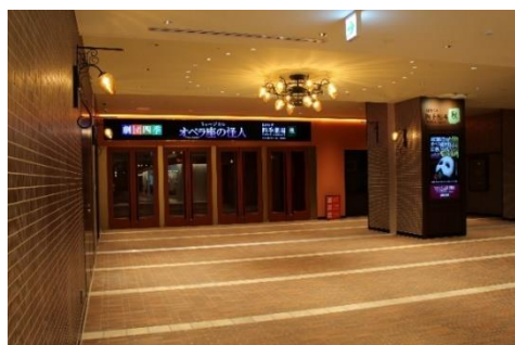
【秋】劇場エントランスロビー