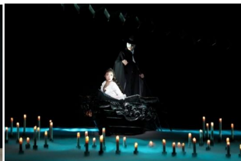
『オペラ座の怪人』