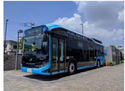
燃料電池バス外観