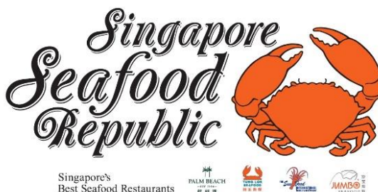
シンガポール シーフード リパブリック 東京