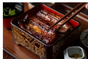
鹿児島県東串良町