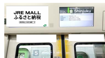
（参考）トレインチャンネルイメージ