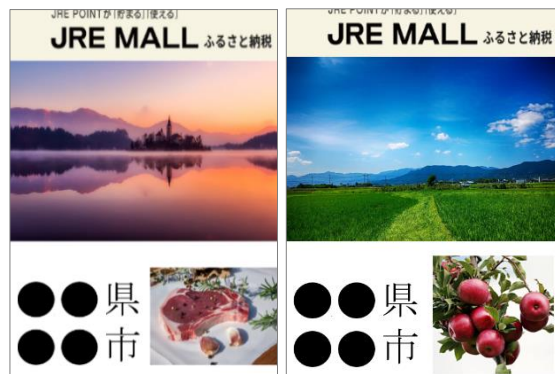
(参考) 自治体 PR ポスターイメージ