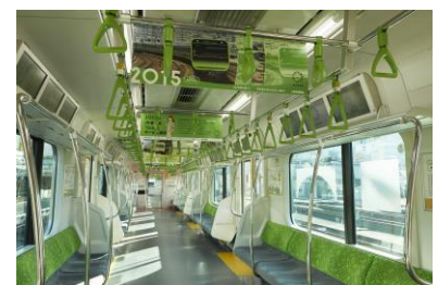
（参考）AD トレインイメージ