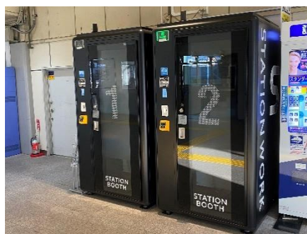
▲STATION BOOTH イメージ