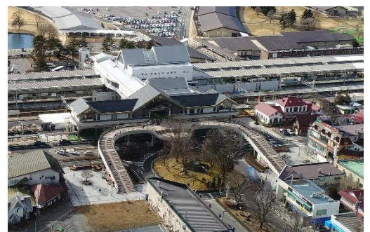
▲さわやかハット外観