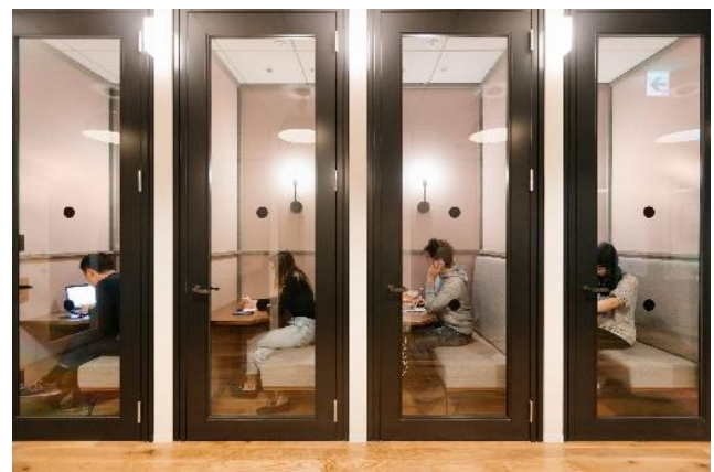
電話ブースもご利用いただけます。WEB会議にも安心してお使いいただけます。