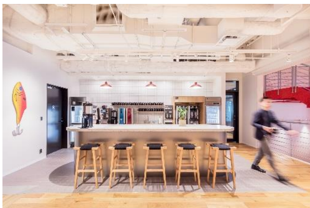
こだわりのコーヒーはもちろん、16時以降はビール*もフリードリンクとしてお楽しみいただけます。