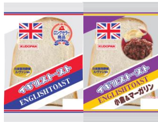
「イギリストースト」

青森県民なら知らない人はいない、50年以上愛され続ける、青森県民のソウルフードです。