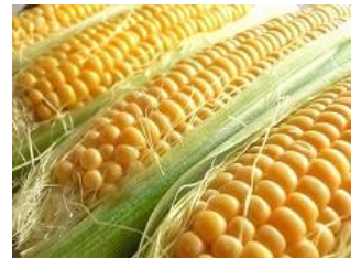
「とうもろこし(嶽きみ)」

糖度が果物を上回る15~16度以上にもなる青森県ブランドとうもろこし「嶽きみ」は今が旬です。