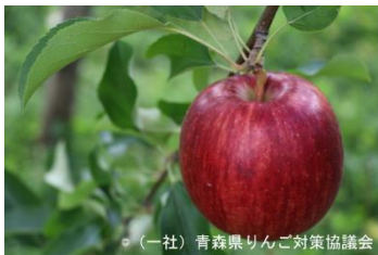
「青森りんご(サンつがる)」