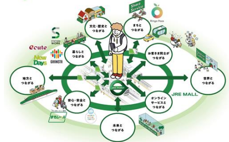
Beyond Stations 構想 「通過する」「集う」から「つながる」へ。

JR 東日本は、これからも、ヒトの生活における「豊かさ」を起点として、リアルな交流拠点である駅の強みを活かしながら、JR 東日本グループだからこそ提供できる新しいサービスをお客さま目線で創造し、駅をビジネスの発信拠点へ変革します。また、デジタル領域においてもお客さま一人ひとりと深くつながることで、One to One のアプローチも進めます。そのため、デジタル顧客接点となるプラットフォームの整備・強化を推進します。そして、リアルとオンラインがシームレスにつながる様々なサービスを JRE POINT(デジタル共通基盤)でつなぎ、JRE POINT を基軸としたロイヤルカスタマー戦略を推進します。これにより、JR 東日本グループならではのデジタルトランスフォーメーションを実現しながら、既存の枠組みを超えてお客さまに提供する価値を最大化し続けていきます。