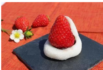
【燦燦園 いちご大福イメージ】

高輪ゲートウェイ駅改札外デッキ特設会場にて、同駅オリジナルの食パンやロールケーキをはじめとしたマルシェを開催します。