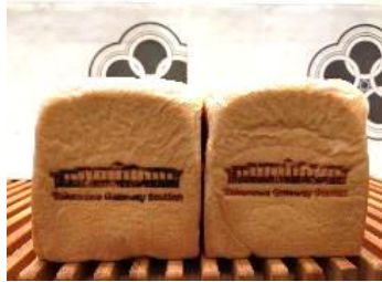
【帝塚山ぱん士郎 本食ぱん】