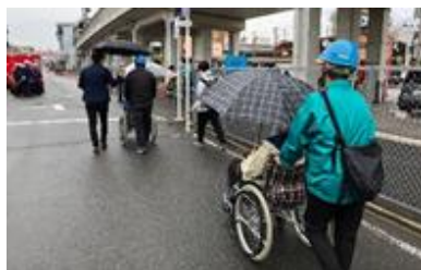
【避難支援体験イメージ】

株式会社パソナテックが開発する、災害時に移動支援が必要な方と地域に住む支援希望者(移動サポーター)をマッチングさせる避難支援システム「防災ヘルプサービス」を活用し、首都直下地震の発生を想定した避難支援の実証実験を実施します。地域の防災情報に触れ、防災意識を高めることが目的です。