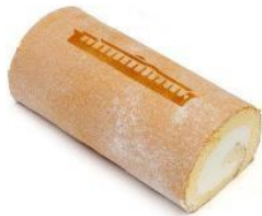
【代官山シェ・リュイ 高輪ゲートウェイ駅限定ロール】