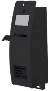
【「JAL xR Traveler」イメージ】

「JAL xR Traveler」は、映像や音だけでなく風や香りも駆使し、よりリアルな疑似体験ができる日本航空株式会社（以下、「JAL」）の次世代型 VR です。JAL と JR 東日本が連携し制作した、初の国内版コンテンツである「青森編」にて、青森出身の JAL 客室乗務員が、新しい青森の魅力をご紹介します。その他、HoloLens2(ホロレンズ 2)での MR 体験・ロボットデモ体験もセットでお楽しみいただけます。