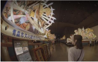
【バーチャル空間イメージ】