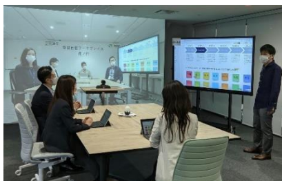
【空間自在ワークプレイスイメージ】

高輪ゲートウェイ駅前に新たに生まれる街。まちびらきに向けて、この街を一緒に考え、つくりあげていきませんか。