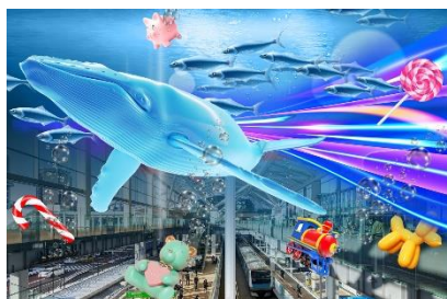
【XR Sea イメージ】

高輪ゲートウェイ駅は、過去には海であったところに立地しています。「XR Sea」では、KDDI 株式会社の XR アプリ「SATCH X powered by STYLY」を起動しスマートフォンをかざすことで、過去と現在が重なるかのように、駅が海の中にある仮想現実空間をご覧ください。