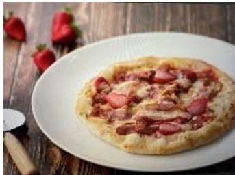
【八芳園 苺のピッツァイメージ】