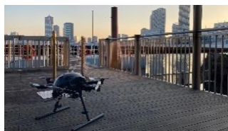
【2021年11月実証実験イメージ】

ドローンを身近に感じていただけるように、手のひらサイズのトイドローンを使ったゲームをご用意しております。また、2021年11月にウォーターズ竹芝で実施したドローンの活用による「エンターテインメント型フードデリバリー」の実証実験映像を放映します。