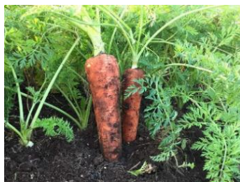
【八百屋瑞花 完一さんのこだわり人参 イメージ】