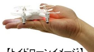
【トイドローンイメージ】