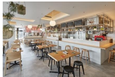
【会場：「K,D,C,,,」3階フードホール】

開催日 : 6月24日（金）、25日（土）、26日（日） 場所 : 新大久保駅ビル 3階 「K,D,C,,,」フードホール （東京都新宿区百人町 1-10-15） 営業時間 : 11:00～18:00（予定）