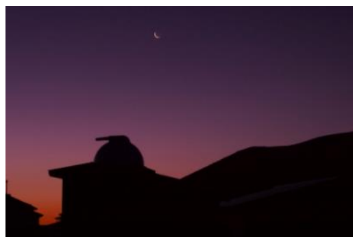
夕暮れの浄土平天文台

雲の上の浄土平は空気が澄み、光害が少ない絶好のスターウォッチングポイントです。天文台スタッフによる星空解説や野外にて福島県在住のプロのヴァイオリン、アコースティックギター奏者による生演奏を行います。時間とともに移りゆく自然を五感で感じていただけます。