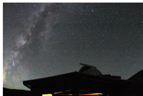
浄土平天文台からの星空