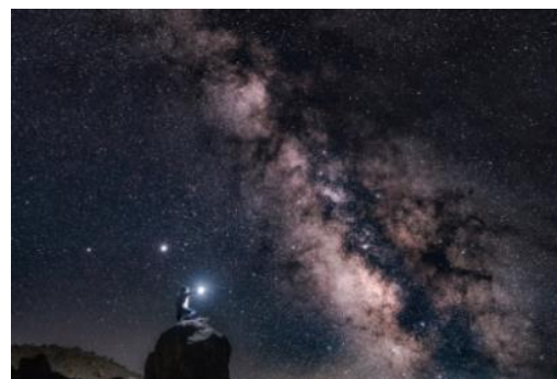
浄土平の満天の星空