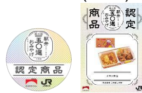
店頭 POP (イメージ)