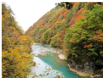
秋田県・抱返り溪谷 (イメージ)