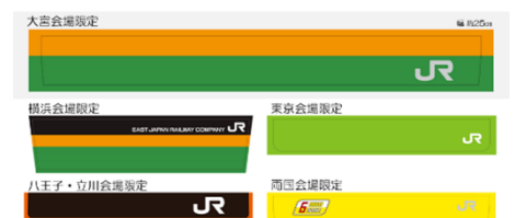
（オリジナルステッカー）

※詳細は、JR 東日本クロスステーション公式 Twitter ( https://twitter.com/ekinakalab ) にてお知らせします。