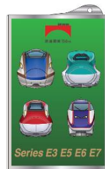
カードケース鉄道開業 150 年 (E3 E5 E6 E7 集合)