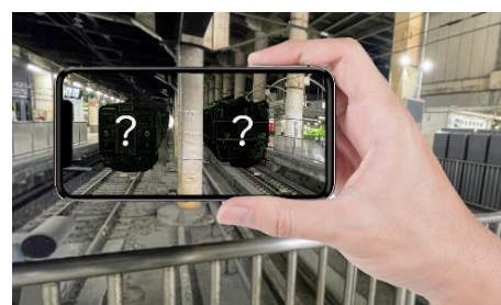
AR 技術を活用した体験イメージ

○参加方法：JRE MALL で特定の商品をお買い上げいただいた方に体験いただく予定