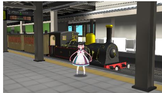
バーチャル鉄道 150 年博物館

「1号機関車」の客車部分を再現・展示、内部を 3D ギャラリー化し、当時の錦絵、関連映像、年表などを VR で視聴可能なコンテンツを設置します。