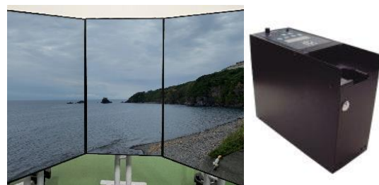
五感体験装置一部（イメージ）