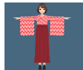
明治時代のファッションを意識したアバター