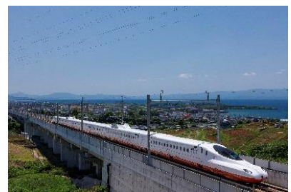
西九州新幹線・かもめ