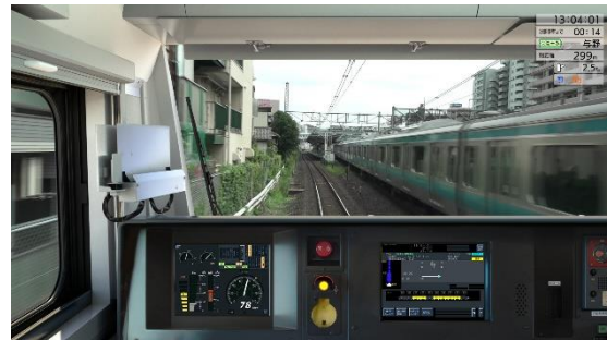
※京浜東北線(E233系) シミュレータ体験イメージ