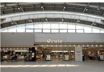
【エキュート日暮里】