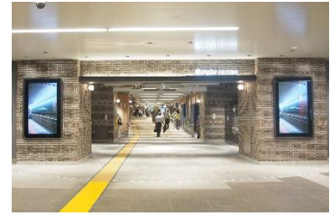
【エキウトエディション横浜】