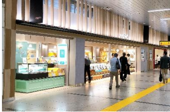
【エキウト大宮 ノース】