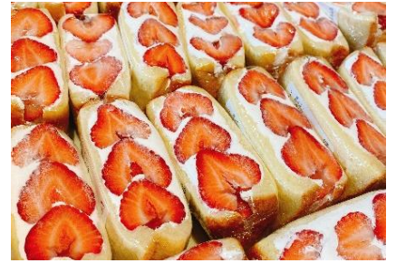
惣菜ベーカリー& カフェ いなこっぺ (高尾)