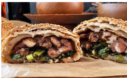
台湾式放浪屋台 地平線 (東小金井) ★