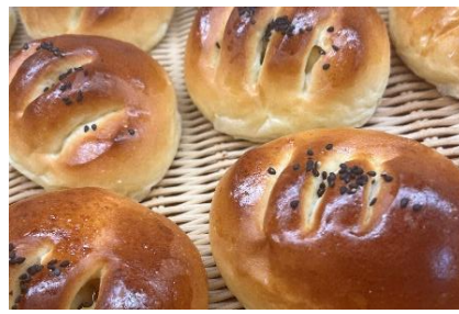
もぐもぐベーカリー (西国分寺) ★