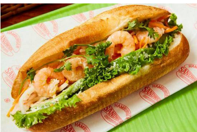
パインミーサンドイッチ (吉祥寺)