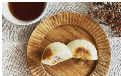
OYAKICAFÉ キイロ (東小金井) ★