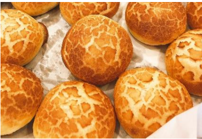
パン工房ティアラ (武蔵小金井) クラウンバーカリー武蔵境店 (武蔵境)