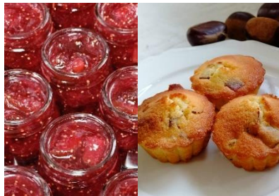
Mi ジャム (三鷹) 菓子工房なつの (小平)