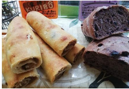
Boulangerie ECLIN (高円寺)