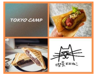
TOKYO CAMP (日本橋) ★ 喫茶おおねこ (吉祥寺) ★