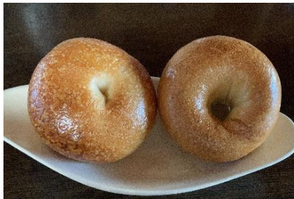
まんまる (武蔵境) ★