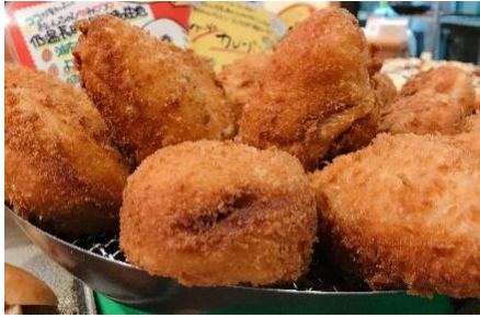
ベーカリーハウスマイ (東久留米)