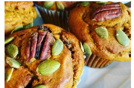
Unicorn Bakery (国立)