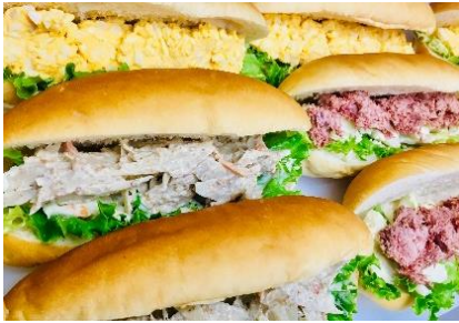
緑町のパン屋さん クラウン (東小金井)