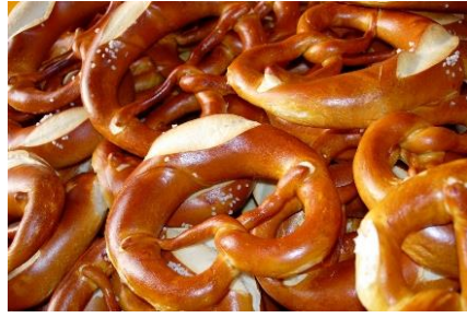
ドイツパンの店リンデ (吉祥寺)