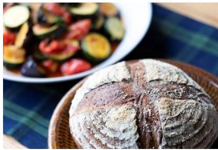
桜天然酵母パンびおりの (武蔵小金井)