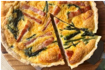
baai no kazu (ひばりヶ丘) ★