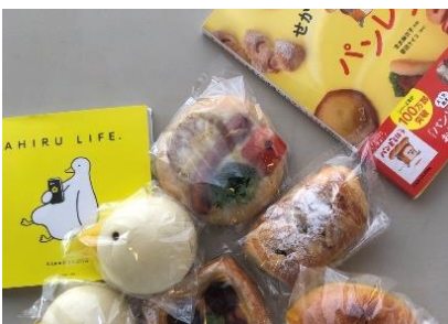
Noël+マルジナリア書店 (分倍河原) ★