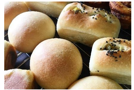
MORI BAKERY (武蔵境)