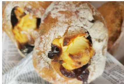
Pains de Fuchu (府中)