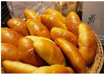
ハースブラウン武蔵境店 (武蔵境) ★