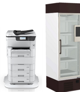
① 複合機 ② 冷蔵スマートショーケース

※7 顔認証のための顔画像および顔特徴量データ(個人識別符号として個人情報に該当)は、パナソニック コネクトが、本実証実験のために定めるプライバシーポリシーに則り、ご利用頂くお客さまの同意を得たうえ、適正に取得・保存します。取得・保存される顔画像および顔特徴量データは、本実証実験の「顔認証 複合機」と「顔認証 冷蔵スマートショーケース」の利用目的のみで利用し、他の目的で利用することはありません。