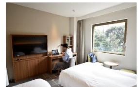
▲ホテルメッツ目白