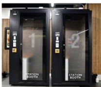
▲ STATION BOOTH