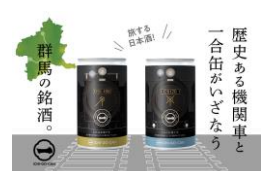
純米吟醸 JR 東日本 SL(D51)・SL(C61) 一合缶®