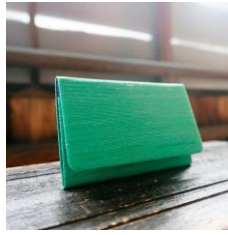
Nitta Fabrics 名刺入れ