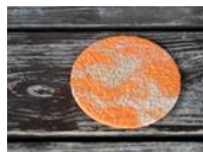
たくみの里和紙の家 コースター