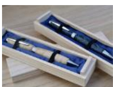
桐匠根津 ボールペン