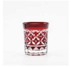
江戸切子ガラス E6 系