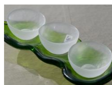
上越クリスタル硝子 まめ菜味トリオセット