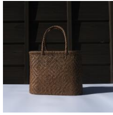
つる工房鷹山 山ぶどうカゴ