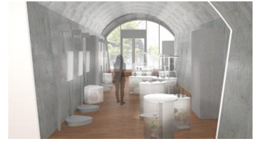
展示空間イメージ

建築家 永山祐子氏設計の展示空間に生まれ変わります。自由曲線で描かれた小石のような平面形状の展示什器が、高さのバリエーションを持ちながら複数台置かれることで、作品展示空間にリズムを生み出します。